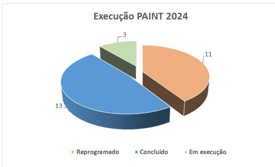
1 - % de execução PAIN'T 2024

Das 27 ações previstas no PAIN'T 2024, 59,3% foram concluídas ou estavam em execução e 40,7% reprogramadas para 2025 (figura 1).